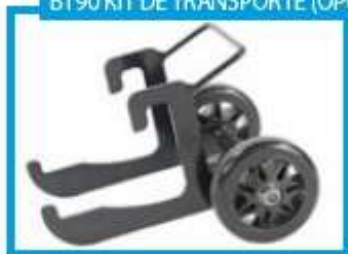
BT90 KIT DE TRANSPORTE (OPCIONAL)